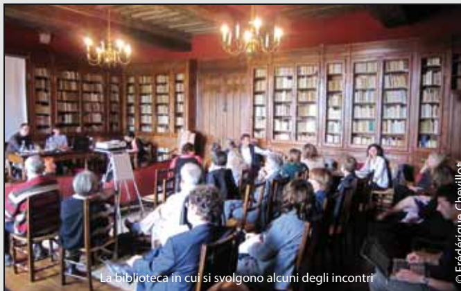
La biblioteca in cui si svolgono alcuni degli incontri

☛ Il sito è classificato Monumento Storico "in ragione della qualità architettonica e della grande coerenza dell'insieme, in quanto luogo di elezione della cultura e della storia, ivi compresa quella del pensiero moderno".