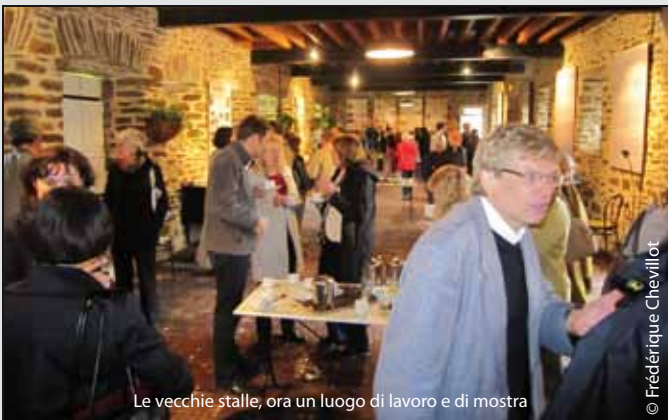
Le vecchie stalle, ora un luogo di lavoro e di mostra